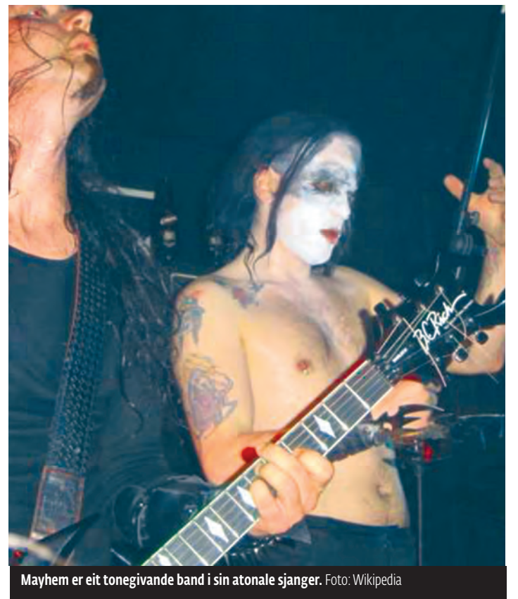
Mayhem er eit tonegivande band i sin atonale sjanger.