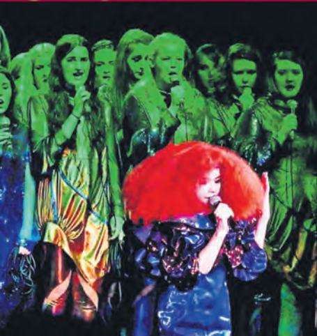
Björk kjem med ny konsertfilm i haust. Foto frå filmen