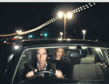
Nick Cave med Kylie Minogue i baksetet. Foto frå filmen

Og så er det Heaven Adores You , filmen om Elliott Smith , den eksepsjonelt talentfulle artisten som stakk ein kniv i brystet og døydde, og bad Gud om tilgiving på ein post-it-lapp, den gongen i 2003.